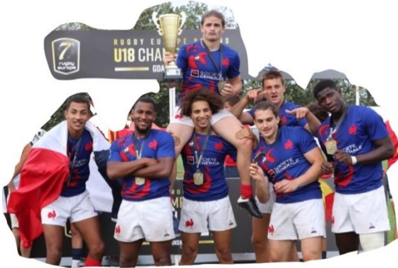
Les Français U18 Champions d'Europe 2021 !