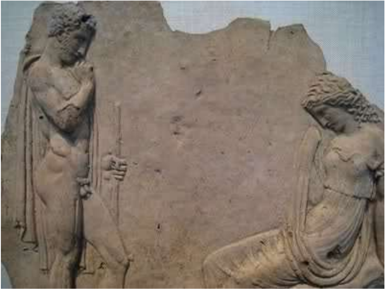
La récompense au vainqueur