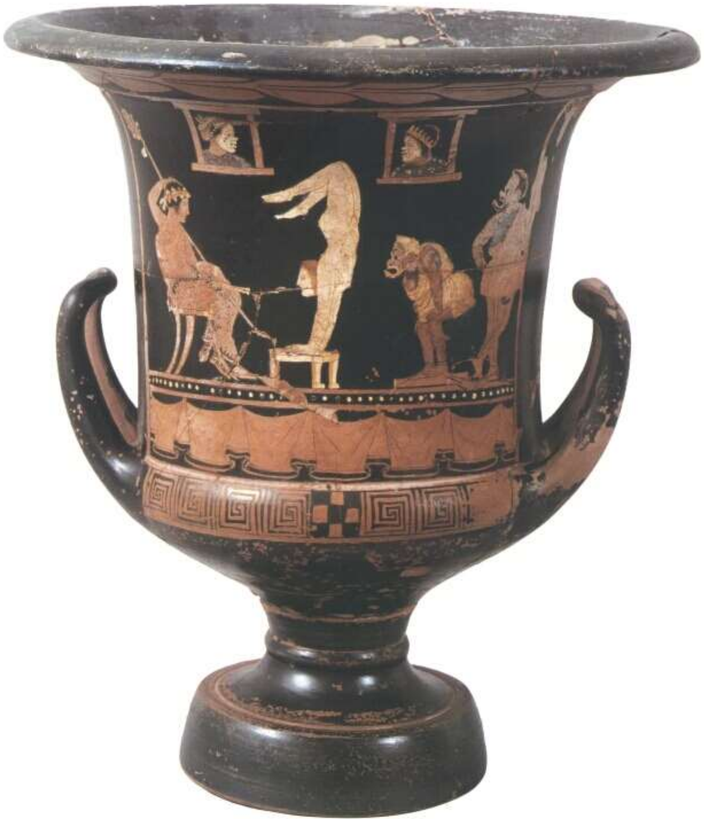
Les figures acrobatiques