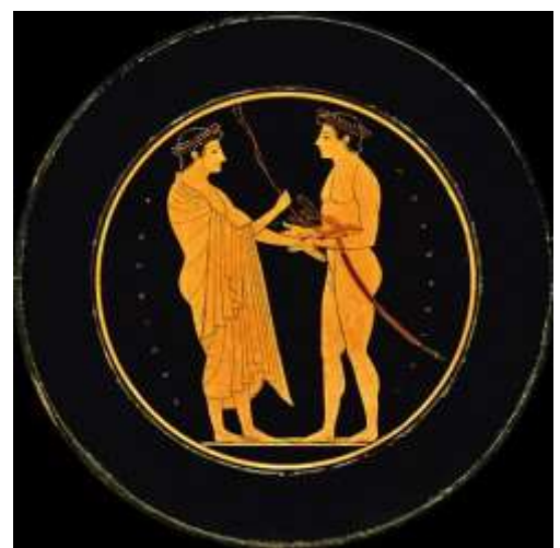
La récompense au vainqueur