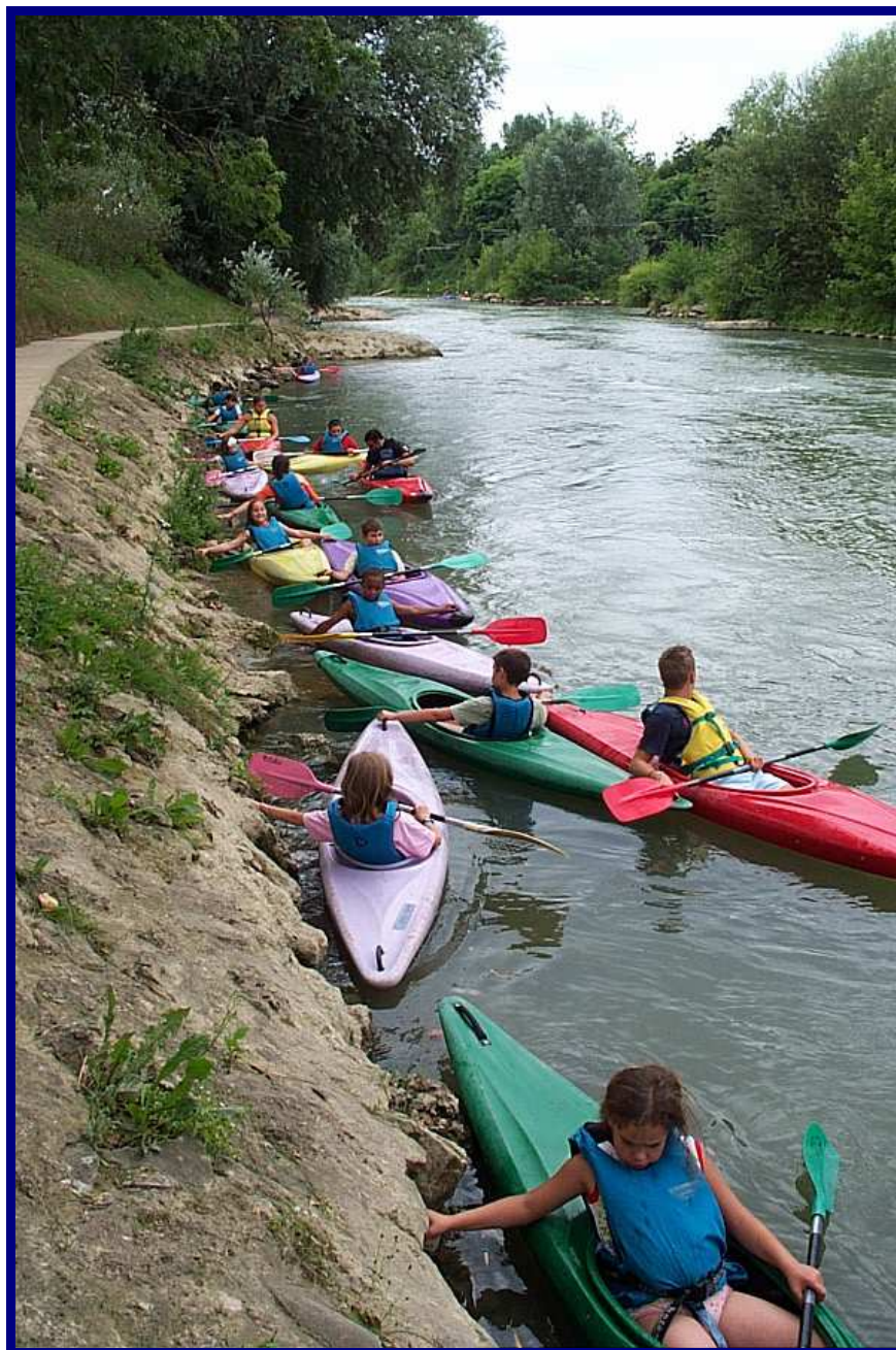
« Voyage sur la base de Champ sur Marne »