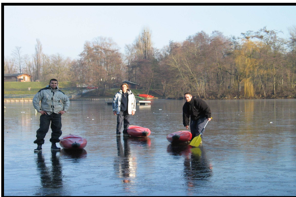
... sur le lac...gelé...