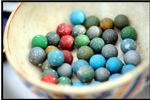
Billes en terre cuite.