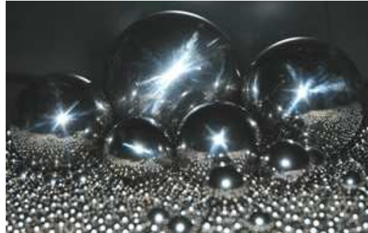
Billes en acier.

Elles sont apparues il y a des milliers d'années et les jeux de billes sont populaires dans le monde entier.