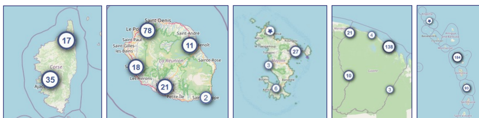
Affichages de la cartographie des partenaires culturels sur ADAGE en zoom large. Les professeurs peuvent centrer la cartographie sur leurs établissements scolaires, 02/08/2022.