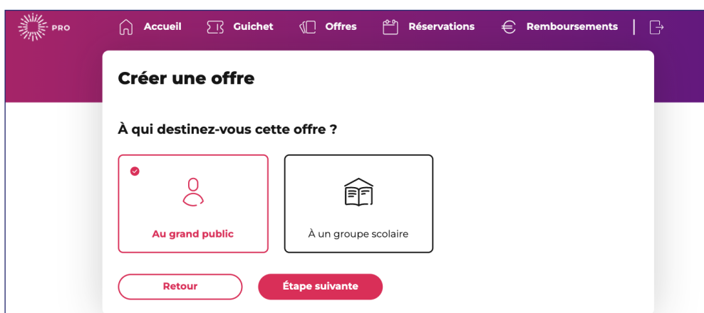
Capture d'écran de la fonctionnalité « À un groupe scolaire » dans le parcours de création d'offre accessible depuis l'espace pass Culture pro.

3. si elle n'est pas activée, remplir le formulaire de « demande de référencement » mis en ligne sur pass Culture pro.