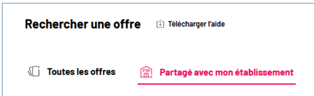
Capture d'écran d'ADAGE, onglet « Partagé avec mon établissement » permettant d'accéder aux offres ciblées.

Si une offre collective a été co-construite en partenariat avec un établissement scolaire, l'acteur culturel peut l'adresser à ce collège ou lycée : l'offre est consultable et préservable uniquement par les personnels de cet établissement, qui ont alors accès à un onglet dédié sur ADAGE.