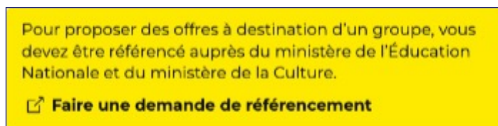
Capture d'écran, sur pass Culture pro, du lien vers la demande de référencement.