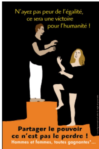
Collège Evariste Galois / Epinay-sur-Seine