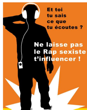
Collège Jean Moulin/Aubervilliers