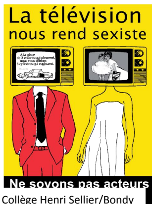
Collège Henri Sellier/Bondy

➔ Affiches : Travailler sur le sens avec les élèves