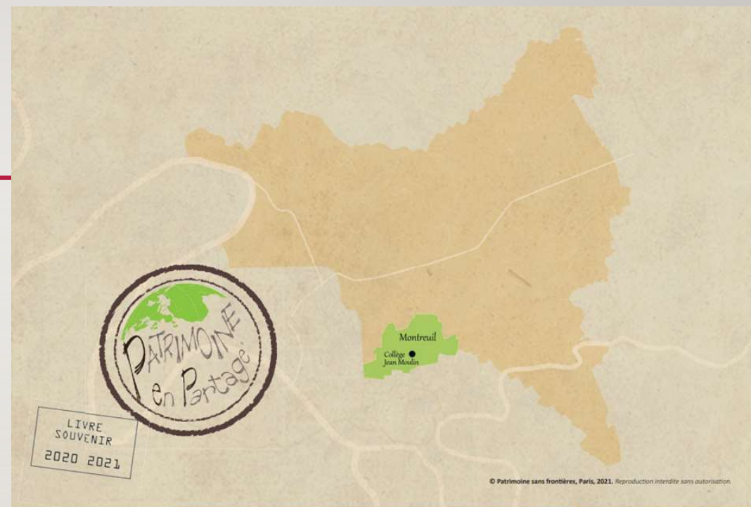
Première et dernière de couverture du livre souvenir de l'UP2A du collège Jean Moulin à Montreuil