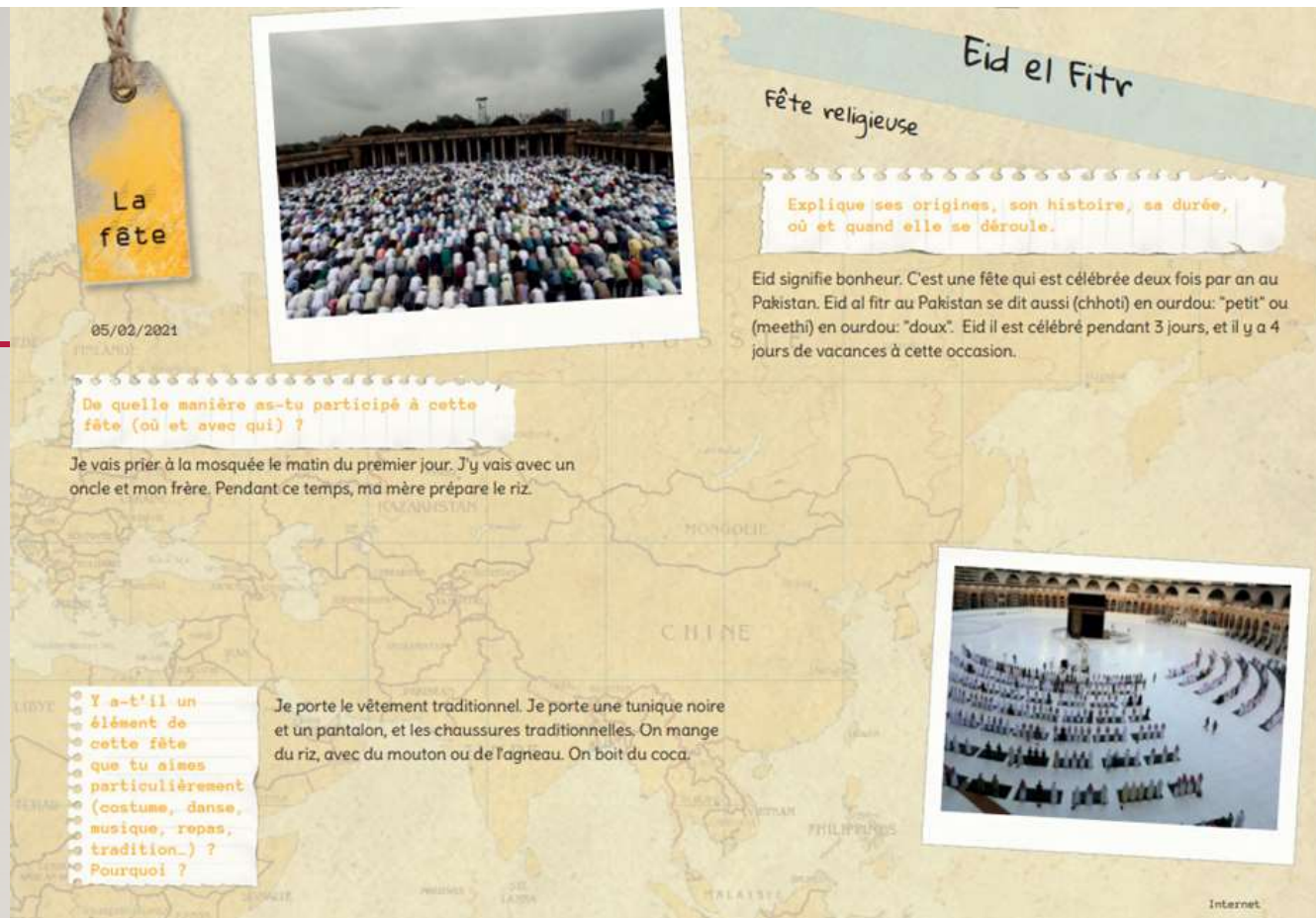
La fête de l'Eid au Pakistan par Hammad, du collège Henri Wallon à Aubervilliers