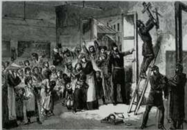
Doc. 4 Enlèvement des crucifixs dans les écoles de la ville de Paris Dessin de Léon Gerlier. H : 18,3 cm ; L : 24,6 cm. Février 1881. Musée Carnavalet, Paris

Il enlève la croix parce que l'école est laïque.