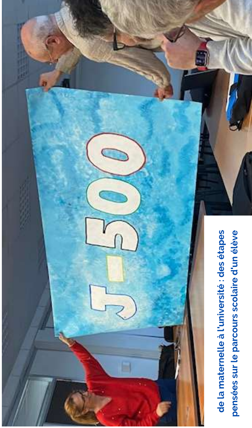
de la maternelle à l'université : des étapes pensées sur le parcours scolaire d'un élève