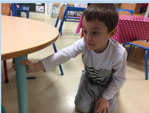
Exploration libre dans la classe

d'approcher quelques propriétés des aimants. En effet, avant de démarrer la fabrication du train, les moyens ont mené des séances de découverte, d'exploration, d'expérimentation et de recherche en classe. Quelques expériences en images :