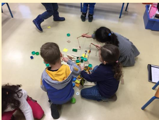
Jeu de pêche à la ligne

Ce que nous avons appris : Un aimant est un objet qui attire d'autres objets.