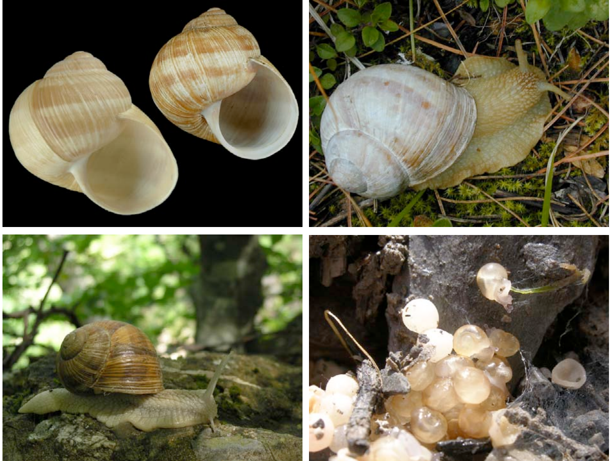
Ponte d'escargot de Bourgogne

Identification : Très grande coquille globuleuse, épaisse, ocre à blanc crème avec des stries d'accroissements. Coquille unie ou avec des bandes spirales très large, parfois indistinctes. Ouverture plus ronde que celle du petit-gris. Dans les bois, les haies, les prairies.