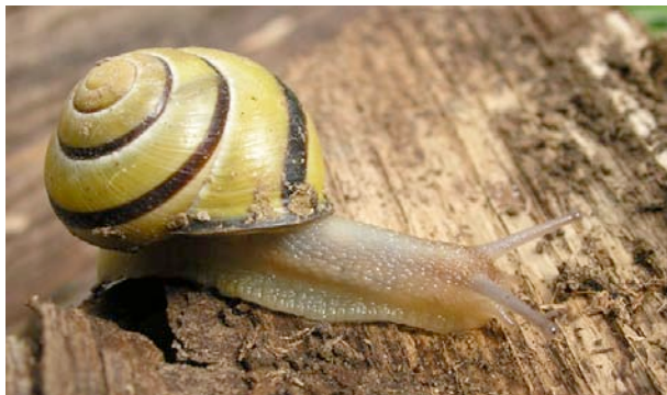
Escargot des haies typique

Ces trois espèces présentent une grande variété de coloration des coquilles, même au sein d'une seule population : tous les individus de la photo de droite ont été collectés sur quelques dizaines de mètres carrés.