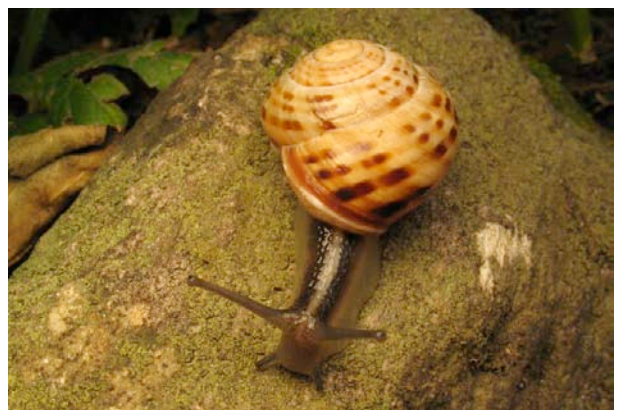
... ou interrompues (escargot des forêts).