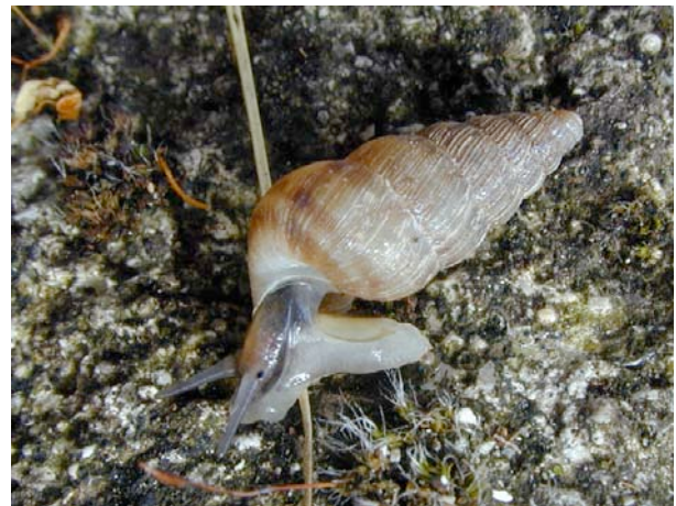
Remarquer l'opercule sur l'arrière du pied et les yeux à la base des tentacules.