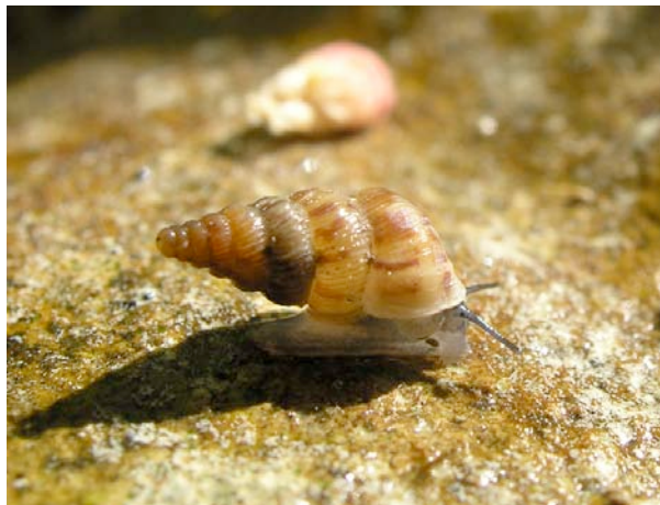
Le cochlostome commun Cochlostoma semptemspirale est le plus répandu des cochlostomes en France. Il vit plutôt dans les endroits humides sur le sol, par exemple sous les pierres ou le bois mort.