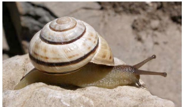
Escargot des forêts