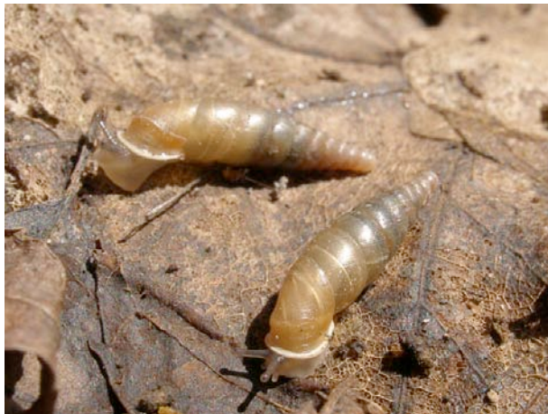
On distingue par transparence les lamelles internes de la coquille.