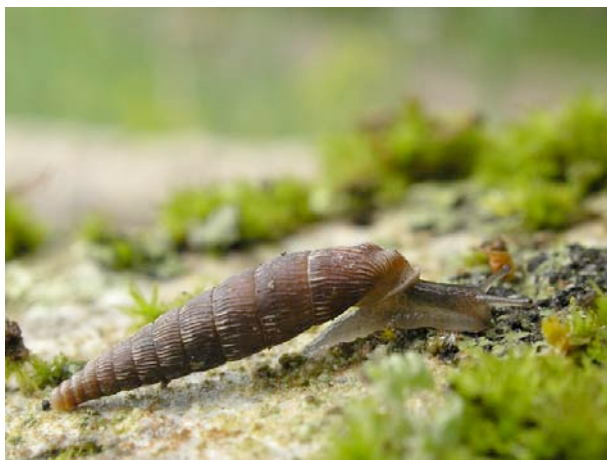
Les lieux moussus et humides sont recherchés par certaines espèces de clausilies, ici la clausilie allongée ( Clausilia bidentata crenulata ).