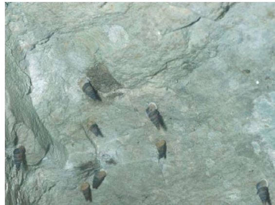
Les cochlostomes se rassemblent parfois en nombre sur les rochers calcaires.