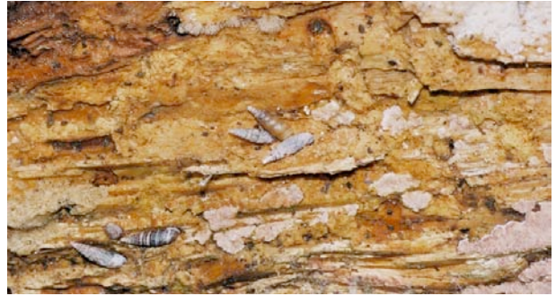
Certaines espèces se rencontrent en nombre sur le bois mort.