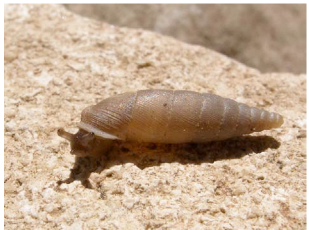
D'autres favorisent les rochers ou les vieux murs (ici la perlée des murailles Papillifera solida )