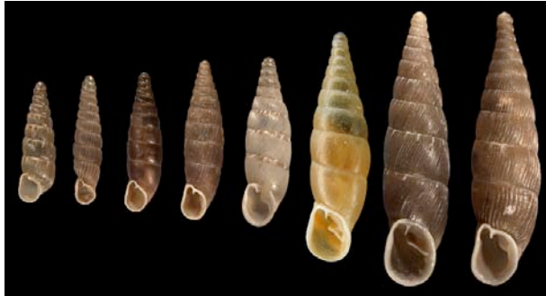
Quelques-unes des 47 clausilies présentes en France. Remarquer la forme caractéristique de la coquille.

Identification : Coquille de taille petite à moyenne, très allongée, toujours sénestre (ouverture à gauche). Forme de quille pour les grandes espèces, d'aiguille pour les petites. Brun sombre à ocre clair, parfois blanche. Ouverture petite et garnie de dents.