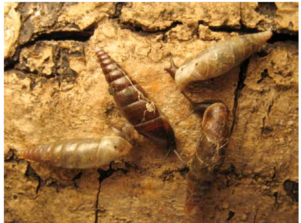
Remarquer la variation de la couleur de la coquille, qui n'est donc pas un critère suffisant pour l'identification.