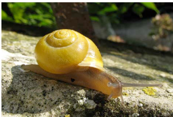
Les bandes peuvent être absentes...