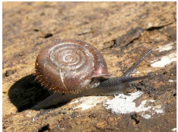
Remarquer les poils sur la coquille