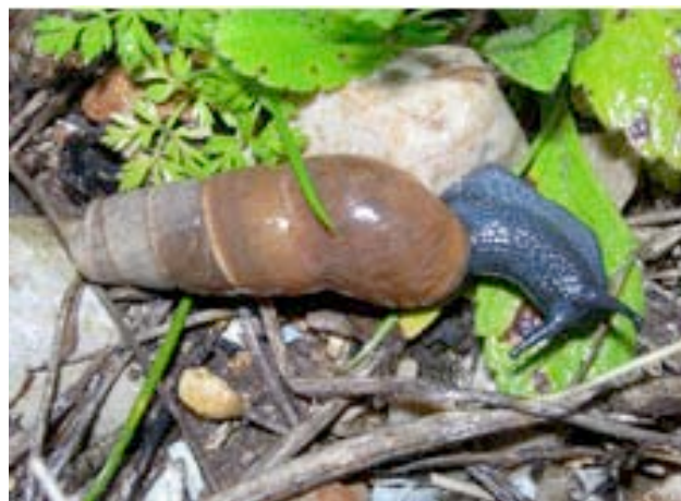
Coquille d'adulte à gauche, de jeune à droite.