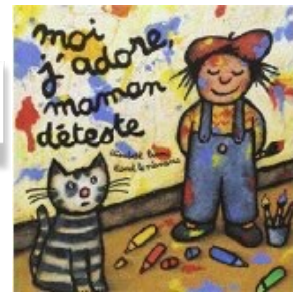
Elisabeth Brami (Auteur), Lionel Le Néouanic (Illustrations) Seuil jeunesse

Projet : S'approprier un album existant pour créer le sien