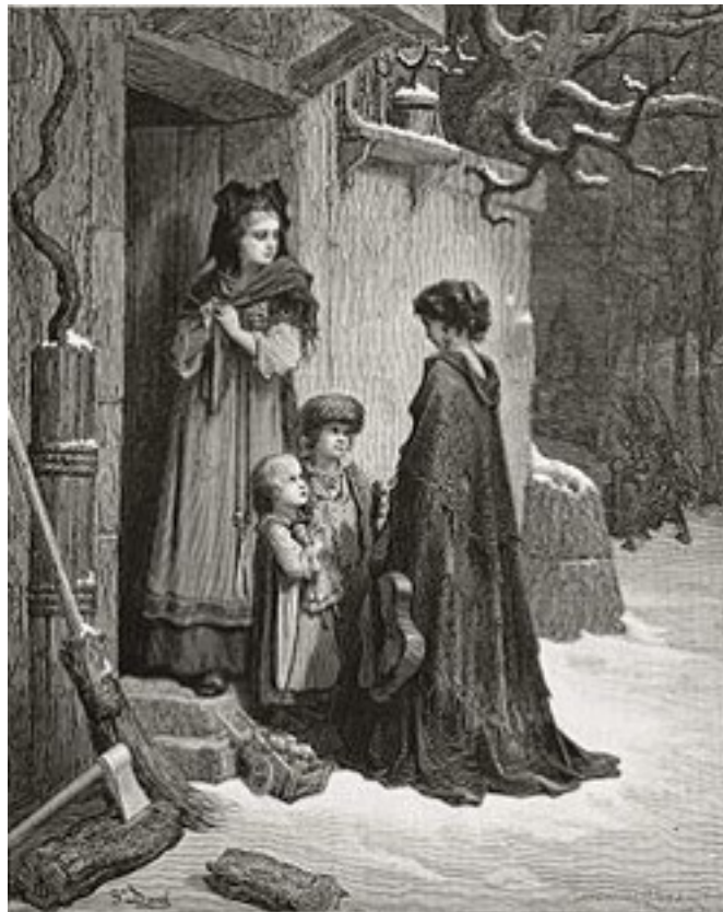
Gustave Doré 1866