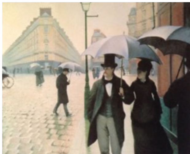
Rue de Paris, temps de pluie Gustave Caillebotte 1877