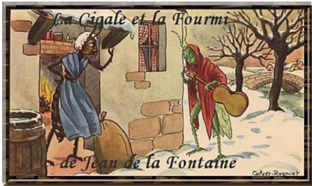
Calvet Rognat 1950