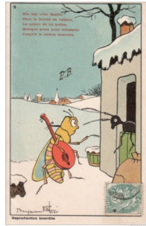
Benjamin Rabier 1905